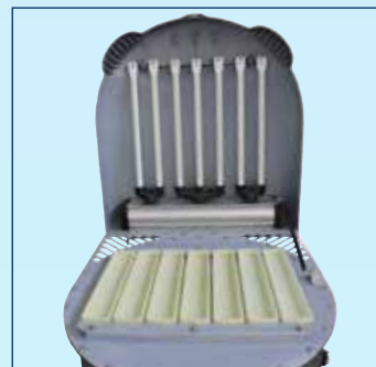
SILOTOP® zero 24.5 m 2

Držák vložek s integrovanými krycími mřížkami